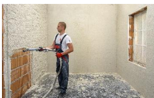
Slika 2. Strojno nanošenje žbuke