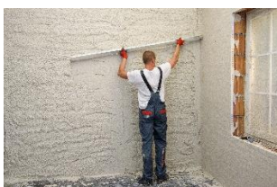
Slika 3. Zaglađivanje žbuke