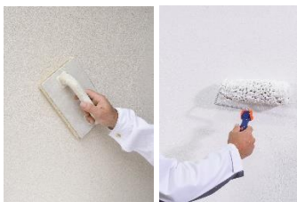
Slika 4. Strukturiranje žbuke